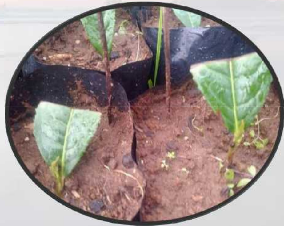
DEMPLOT PEMBIBITAN TEH DI NGEMPLAK